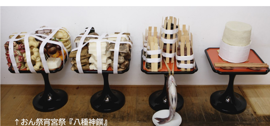
↑おん祭宵宮祭『八種神饌』